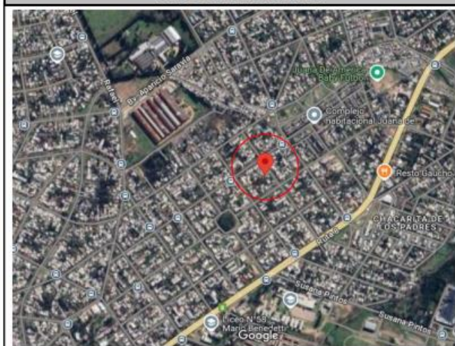
PLANO DE LA MICROZONA